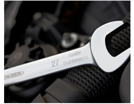
Identifizierung und Rückverfolgbarkeit von Werkzeugen