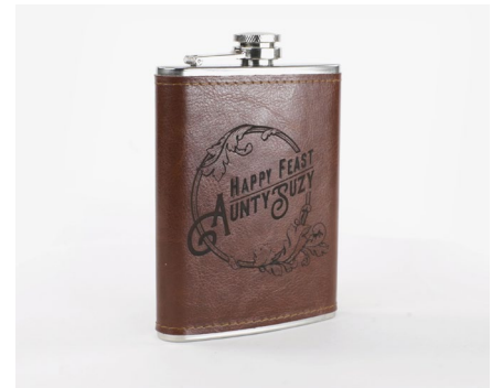
Geschenkartikel und Personalisierung