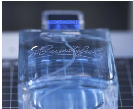
Kosmetik & Luxus