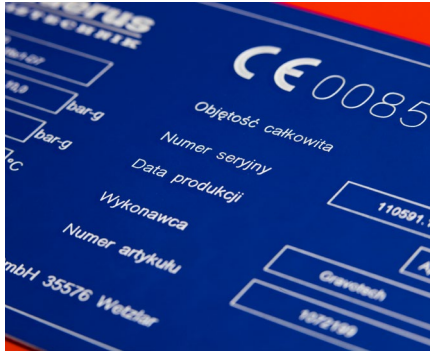
Rückverfolgbarkeit von Industrieteilen