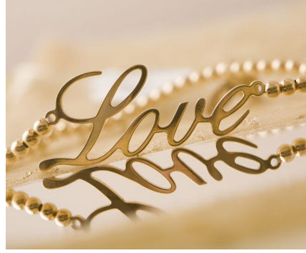
Schneiden & Gravieren