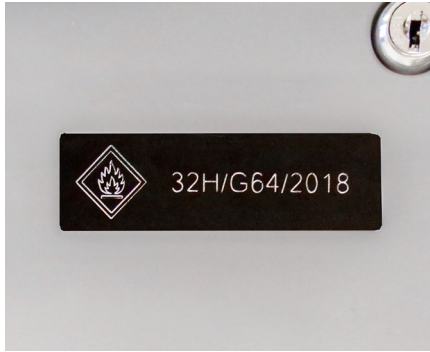
Identifikation und Rückverfolgbarkeit von Geräten