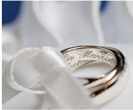
Personalisierung und Gravur von Schmuck