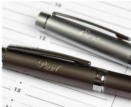
Gravur von Schreibgeräten