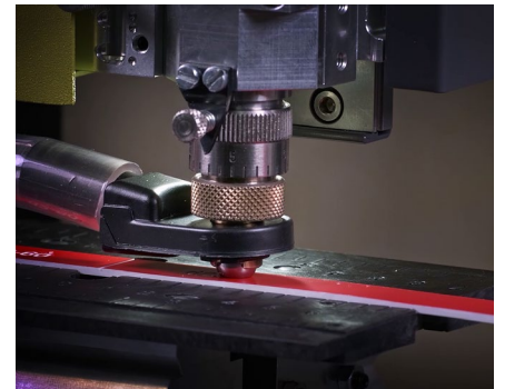
Erstellung von Typenschildern