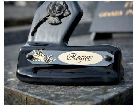
Gravur von Grabplatten und Grabsteinen