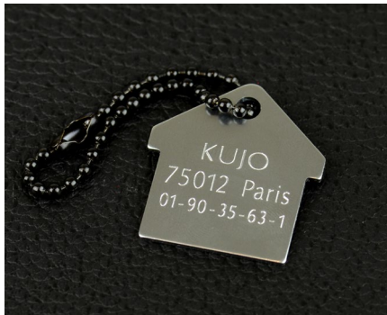
Gravur von Tieranhängern