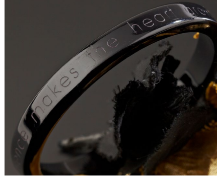
Personalisierung von Schmuck und Geschenken (Ringe, Armreife, Anhänger...)